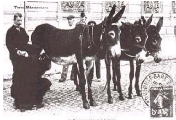
Dans les rues de Toulouse, début XXè

utilisées en France jusqu'entre les deux guerres.