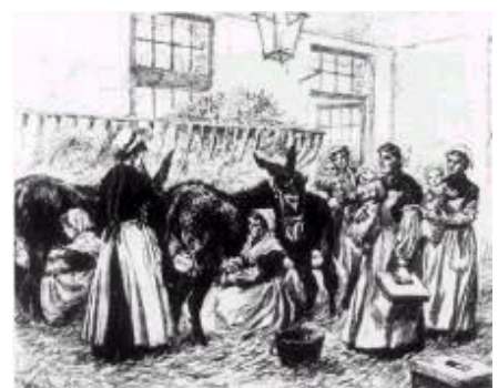
Orphelins nourris directement au pis des ânesses Assistance Publique (fin XIXè)